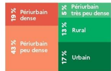
Répartition de la consommation d'espace 2009-2019 par typologie de commune

Tous les territoires sont concernés, majoritairement en secteur détendu et en particulier le périurbain peu dense.