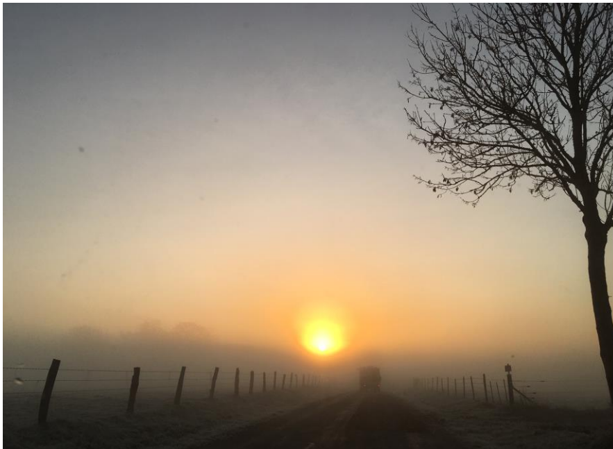
Levers de soleil d'hiver sur Warluzel